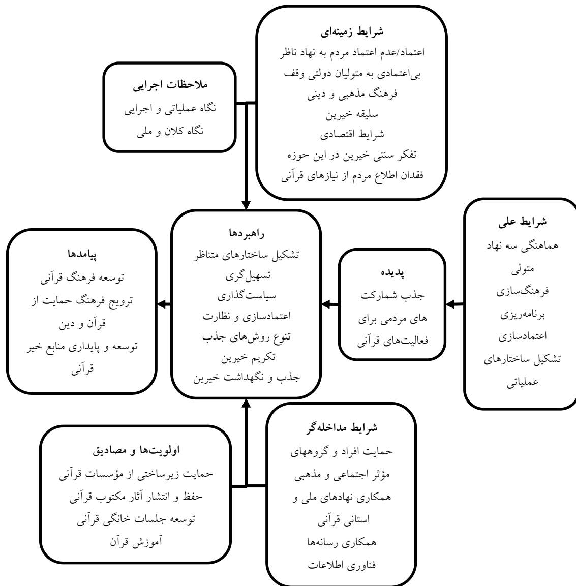
تصویر ۲. مدل جذب مشارکت‌های مردمی برای فعالیت‌های قرآنی بر مبنای نظریه داده‌بنیاد